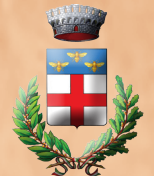
SANTA MARIA NUOVA