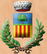
SERRA DE' CONTI