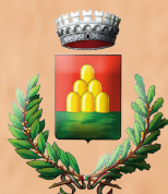
MONTE SAN VITO