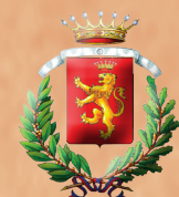
POGGIO SAN MARCELLO